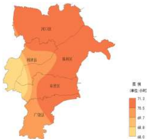
东营市2024年1月上旬日照时数分布图